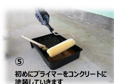
⑤ 初めにプライマーをコンクリートに塗装していきます