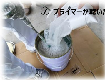
⑦ プライマーが乾いたので、いよいよパワーミキサーで混ぜます