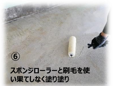
⑥ スポンジローラーと刷毛を使い果てしなく塗り塗り