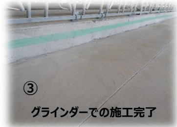
③ グラインダーでの施工完了