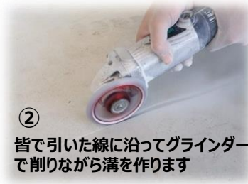
② 皆で引いた線に沿ってグラインダーで削りながら溝を作ります