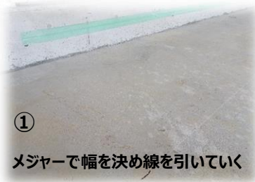
① メジャーで幅を決め線を引いていく